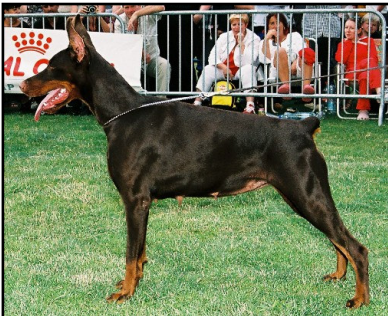
Brown Siegerin – Modus Ost Rush Raketa