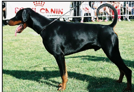
Black Junior Sieger – Diragos II Divo