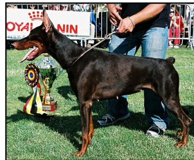
Brown Junior Siegerin – Zarina Rivien del Fiorsilva