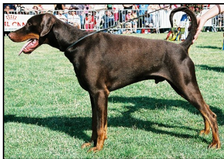
Brown Junior Sieger – Aragon von Hohenzollern